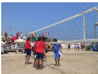
Une vision du sport à contre courant

a été une véritable aventure humaine avant tout. On est bien plus sérieux que dans une compétition classique, la recherche de la performance n'est pas l'unique objectif, chacun s'encourage mutuellement. La participation à ce rassemblement a permis à certains de voir autre chose que sa pratique habituelle à l'intérieur de son club.