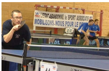
Fédéraux de tennis de table à Brest le 17 janvier 2009

www.snepfsu.net/actualite/docactualite/07jan09.php